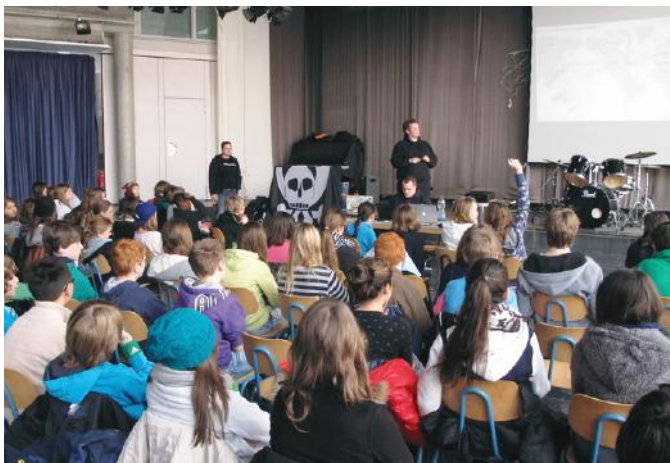
Schülerinnen und Schüler diskutieren mit dem CCC über soziale Netzwerke.

Im Sinne der Hackerethik möchten wir den Spaß am Gerät fördern. Wir klären über die digitale Welt auf, ohne Vorschriften zu machen und ermöglichen so ein Überdenken des eigenen Handelns. Für unsere Workshops besuchen wir meist Schulen und passen die Inhalte im Vorfeld gerne individuell an. Zusätzlich führen wir auch Workshops für Eltern durch.