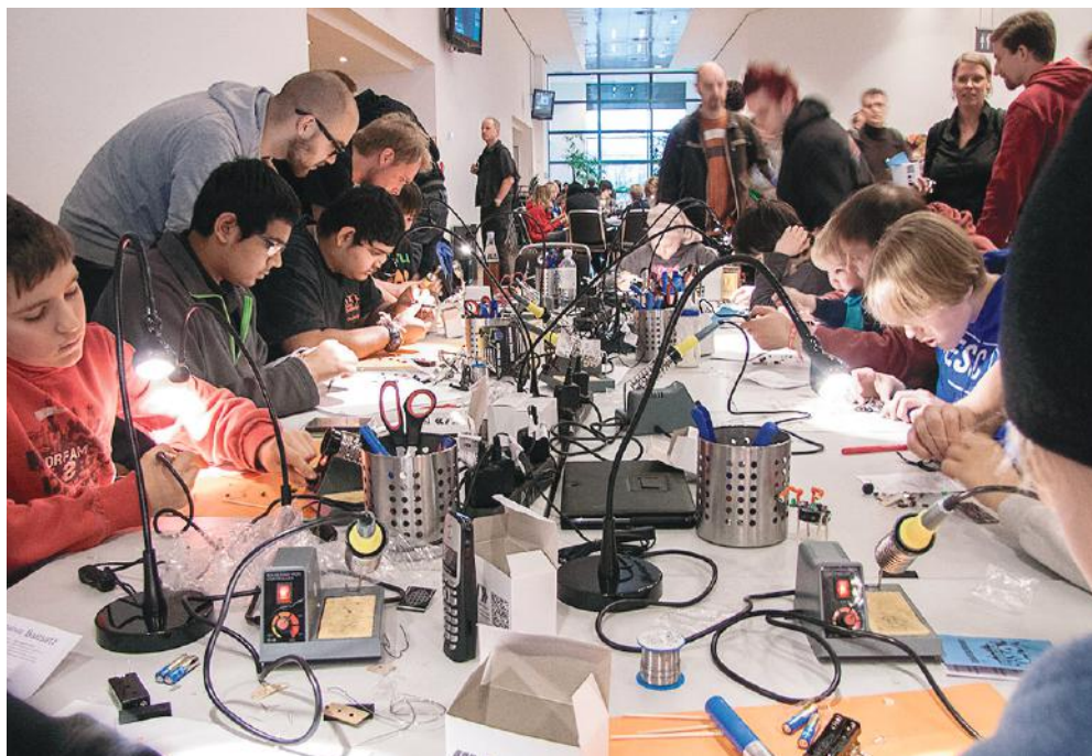
Jugendliche löten beim Chaos Communication Congress einen Microcontroller, den sogenannten Pentabug.

Wir leben in spannenden Zeiten. Ähnlich wie die Einführung des Buchdrucks oder der Elektrizität ist die Digitalisierung aller Lebensbereiche eine Revolution, die tiefgreifende gesellschaftliche Änderungen bringt. Vielleicht ist die Digitalisierung die bisher größte Revolution der Menschheitsgeschichte.