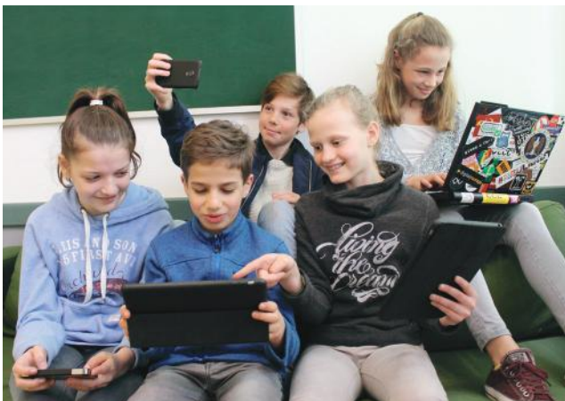
Spaß am Gerät steht bei Chaos macht Schule im Mittelpunkt.

Unterstützt wird das Projekt Chaos macht Schule durch die Wau Holland Stiftung, einer gemeinnützigen Stiftung, die nach einem der Gründer des CCCs benannt ist.